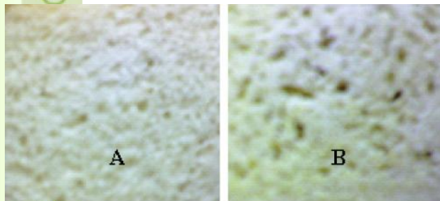
Gambar 2. Perbandingan Penyebaran Pori Lebih Merata Pada Roti Kontrol (A) dan Penyebaran Pori Tidak Merata pada Roti dari Tepung Komposit 30% (B) (Citra HP Camera Sony Ericsson 608i)

Pori-pori yang berukuran relatif besar menunjukkan bahwa adonan roti tersebut mampu menahan gas yang dihasilkan yeast pada saat proses fermentasi, seperti roti kontrol